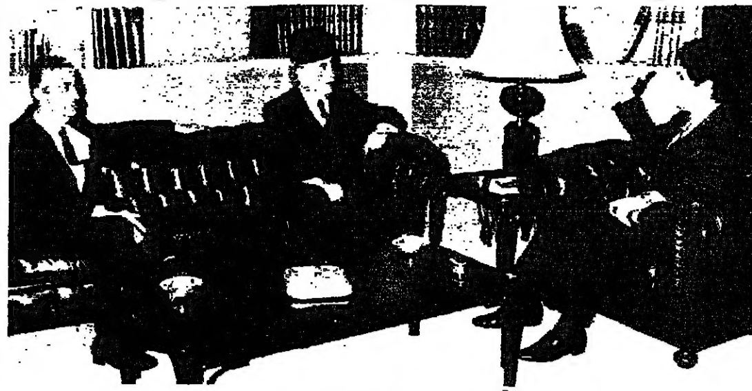
الرئيس الجميل مع تقي الدين الصلح والهرابي

أكد رئيس مجلس النواب السيد حسين الحسيني بعد لقائه الاسبوعي مع رئيس الجمهورية دعمه للاتجاه الرامي الى انقاذ لبنان وانهاء الازمة واعتبر ان شرط نجاح اي وقف تامين لتفوق بين اللبنيين والرئيس تقي الدين الصلح بدوره قال بعد زيارة قصر بعبدا نحن نترقب ونراقب وعندما يظهر الاتفاق لا بد ان يكون لكل مواطن رايه في ما بعد. وصلى الرئيس الحسيني الى القصر الجمهوري في الثانية عشرة وعرض مع الرئيس الجميل الاوضاع. وافر الزيارة ادق بالتصريح الاتي: كانت مناسبة لتقديم التهنئة بالاعجاب الجديدة وانتزها فرصة لتوجه من جميع اللبنيين. واسأل الله ان يعيد هذه الاعيان عليهم وقد خرج لبنان من محنته وتعاقد وعد ان حقه الطبيعية التي تمكنه من الاحتفال باعيادها كما كندوا ويحتفلون في السابق وهذا ما يتفقنا ان النقطه الاساسية التي هي تكليف الجهد وحشد الطاقات من اجل تخليص فكرة انهاء الازمة وانهاء الحرب. ومن هذه الزاوية ننظر الى المباحثات الجارية ودعم واتجاهه وعلمنا اننا نؤيد اي اتجاه لا يضر لبنان بل يخلصه من الازمة التي يصابها في هذه المرحلات الحرجة.